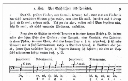
Die Theorie der «Nebentonarten» bildet die Brücke zum Dissertationsprojekt zu Beethoven (J. G. Albrechtsberger, Gründliche Anweisung zur Composition , Leipzig 1790)