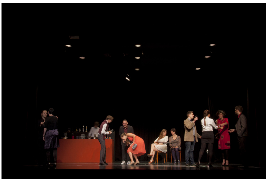
Happy Hour von Hans Wüthrich, Produktion der Klasse Théâtre Musical unter Leitung und in der Inszenierung von Pierre Sublet.

Von zentraler Bedeutung für das Forschungsvorhaben sind die Dimensionen der Intentionalität, Wahrnehmung und Performativität von Sprechereignissen bzw. Sprechhandlungen im Bereich Musiktheater. Im Fokus steht dabei der Aspekt des historischen Wandels: Was in Blütezeiten der gehobenen Bühnensprache zu Beginn des 20. Jahrhunderts normbildende Kraft für jede Art von öffentlicher Rede besass, soll auf seine derzeitige gesellschaftliche Funktion, Wirkung und Relevanz hin neu befragt werden. Eine Auseinandersetzung mit dieser Thematik soll ferner dazu beitragen, eine bisher theoretisch nur vage bestimmte ästhetische Richtung genauer zu fassen.