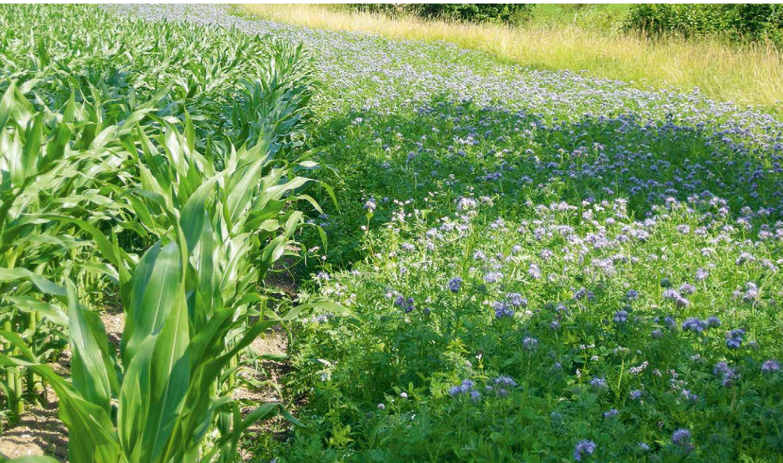
Figure 1 | Les plantes qui fleurissent durant la période estivale de faible miellée doivent améliorer l'offre en nourriture pour les pollinisateurs et autres auxiliaires: bandes fleuries durant le pic de floraison des phacélies.

Renseignements: Hans Ramseier, e-mail: hans.ramseier@bfh.ch