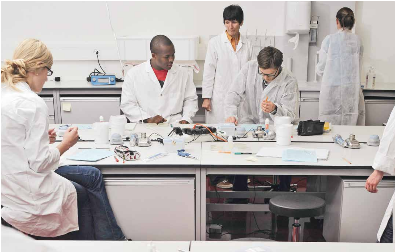
Associer la théorie et la pratique : les journées de formation à la HAFL

La HAFL tient une liste regroupant des sociétés suisses du secteur agroalimentaire. Il s'agit en principe de structures qui forment également des apprenti-e-s. Le responsable des stages en Sciences alimentaires à la HAFL est là pour vous aider à trouver une place si vous en avez besoin.